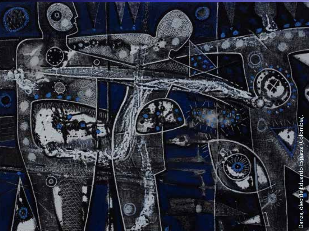
Danza, óleo de Eduardo Esparza (Colombia).